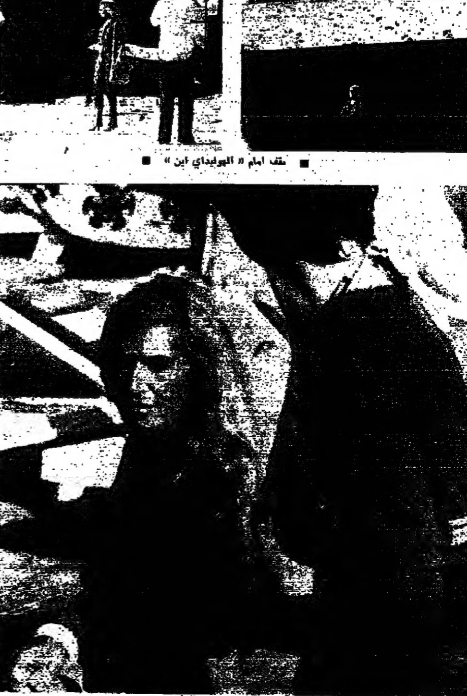
مقابلة امام " البويناياي ابن "

كيف نتصور الى المغرب حضرا ومستقبلا بعد الانتخابات ، وما هو دور تسيير الحركة الجديدة من الحياة الديمقراطية على ارضاع البلاد ؟